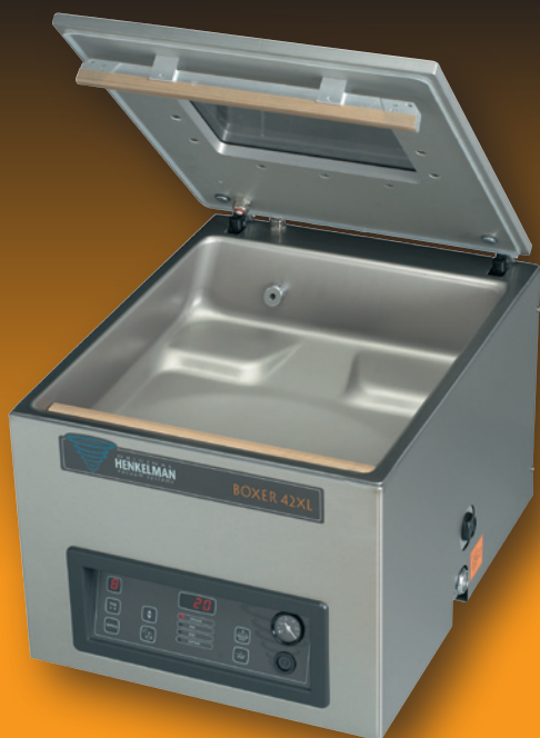
BOXER 42 XL Bi-ACTIVE