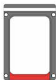
Taille standard 191x 138 mm