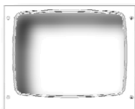
1 empreinte pour GN ½ ou GN1/3