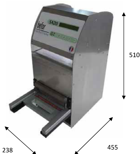
Outillage standard double format

Machine semi-automatique permettant de sceller hermétiquement les barquettes de 250 à 2000 grammes, les GN1/8 en PP, PS, OPS, avec différents films complexes.