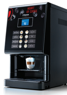
Phedra Evo Espresso 7g